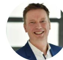
pierre de vos